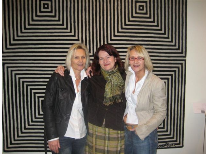
Die drei Grazien vor einem der verzaubernden Künstler- und Designerteppiche .