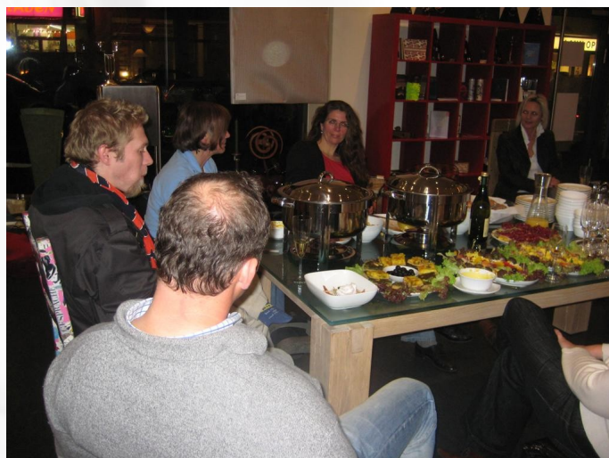
Nach den kulinarischen Köstlichkeiten gibt es geistige Genüsse...